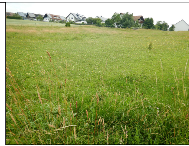
Fläche 146 & 147